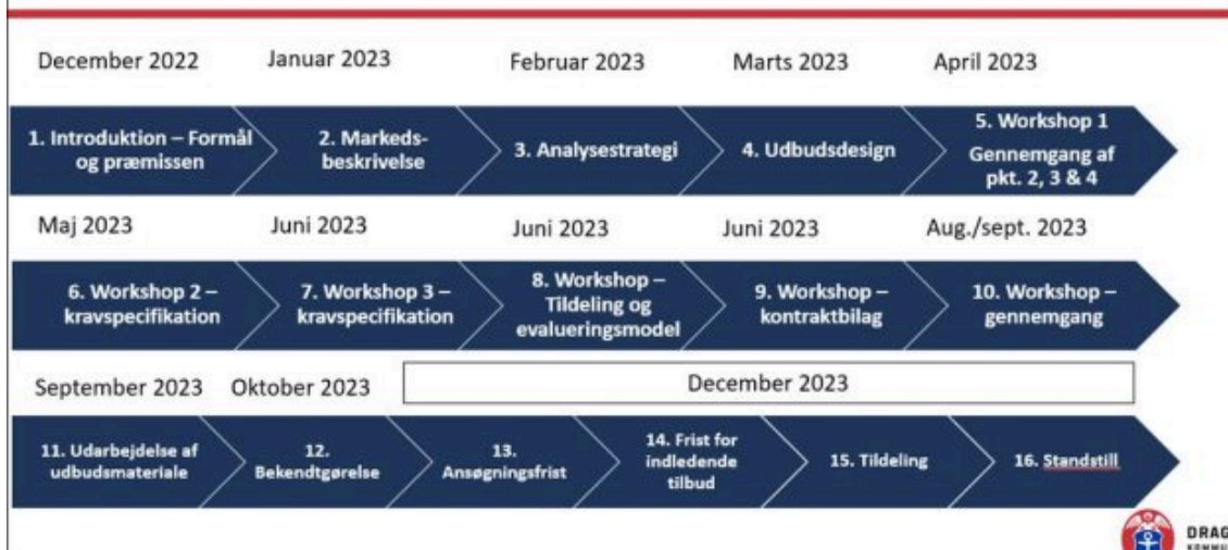
Figur 2: forslag til revideret tidsplan.

I forhold til den oprindelige projektslutdato betyder dette, at projektet formentlig forlænges med 1 måned. Driftsdato var oprindeligt fastsat til 1.1.2024, og dette er principielt muligt stadigvæk, navnlig hvis workshops 5-7 viser sig at kunne komprimeres yderligere. Forlængelsen af forberedelsesfasen og markedsdialogen kunne også tilsammen betyde, at det vil være hurtigere at gå i drift efter tilbudsgivning, men det er ikke sikkert. Så allerede nu kan det være rettidig omhu at forberede sig på en driftsdato, der snarere hedder 1.2.2024.